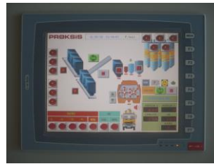
10,4" RENKLİ EKRAN

Bilgisayar arıza yaptığında operatör panelinden tam otomatik üretim yapılabilen, ekrandaki buton simgelerine dokunmak suretiyle manuel işlemler gerçekleştirilebilmektedir.