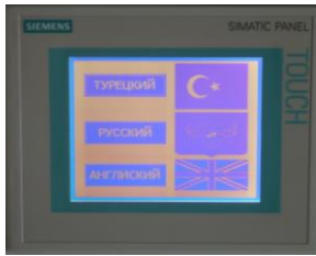
5,7" İKİ RENK EKRAN