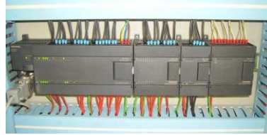
SIEMENS S7-200 PLC